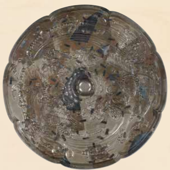
かちやうはいのはっかくきやう 花鳥背八角鏡〔北倉〕