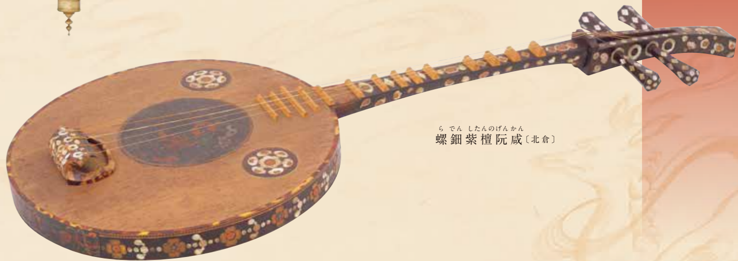
ら でん したんのげんかん 螺鈿紫檀阮咸〔北倉〕