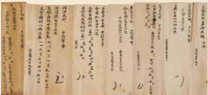
ぞくぞくしゅうしやうそういん こもん じよ 続々修正倉院古文書第三十二帙 第一卷 【奉写一切経所経師筆手実帳】(部分)〔中倉〕