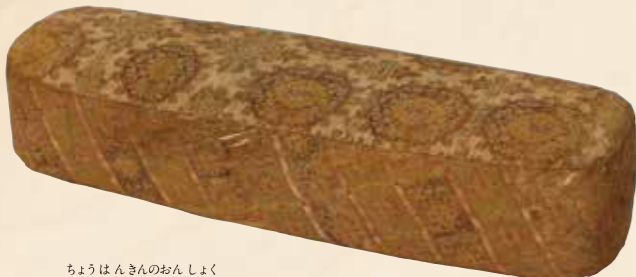
ちやうはんきんのおんしよく 長斑錦御帔〔北倉〕