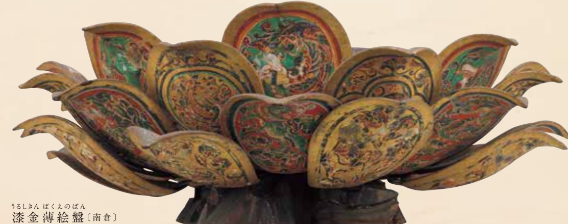
うるしきん ばくえのばん 漆金薄絵盤〔南倉〕