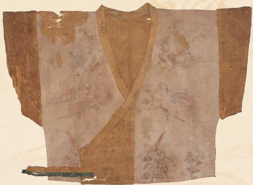
ばく ふ さいえのはんび 曝布彩絵半臂(正面)〔南倉〕