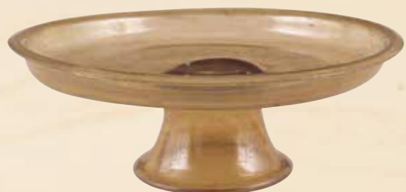
はく りのたかつき 白瑠璃高坏〔中倉〕